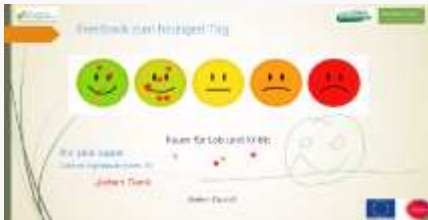
digital & vor Ort