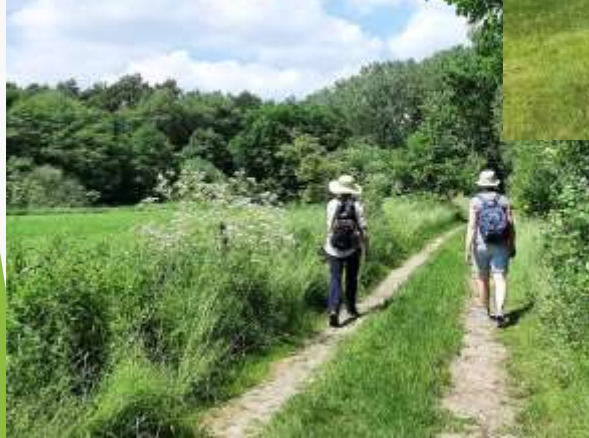
Ein Naturerlebnis für Körper, Geist und Seele