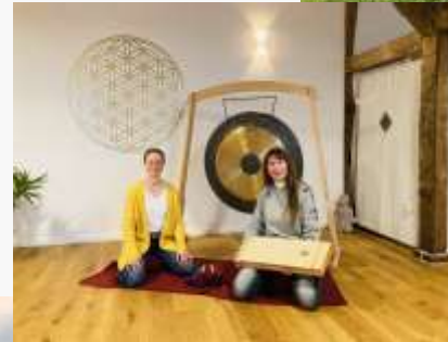
Netzwerkpartner entwickeln gemeinsam ihre Angebote