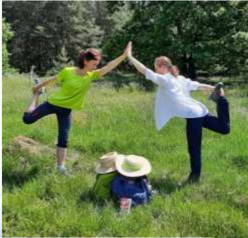
Yoga und Wandern