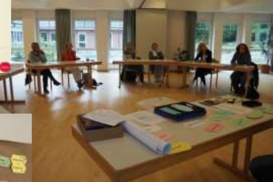
digital & vor Ort